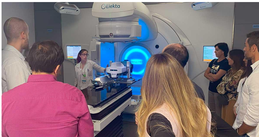
Höjdpunkter från det senaste Delta4-användarmötet på Hospital Central De La Defensa Gómez Ulla i Madrid. Evenemanget organiserades av vår spanska distributör, Fimecorp International S.L., och samlade yrkesverksamma inom medicinsk fysik från kliniker över hela Spanien.

Marknadsföring och försäljning styrs från huvudkontoret i Uppsala samt via dotterbolag i USA, Frankrike och Kina. I resterande länder bidrar ett 40-tal distributörer till bolagets framgångar.