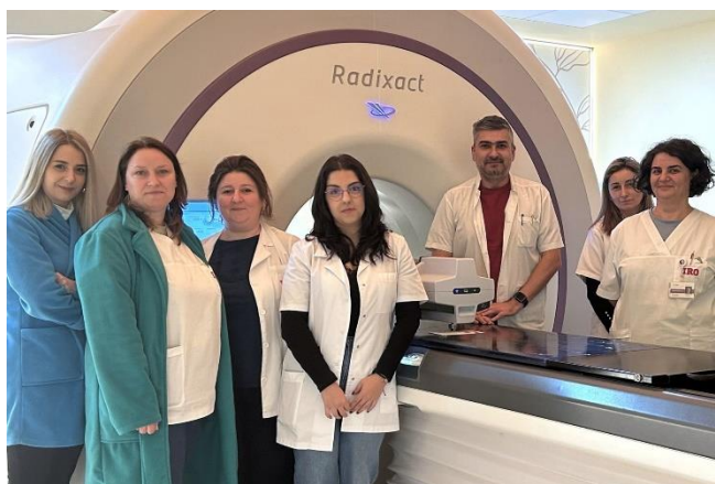
Delta4 Phantom+ installation vid Regional Oncology Institute Iași (IRO Iași) i Rumänien. Med installationen av sitt första Accuray Radixact-system valde kliniken Delta4 Phantom+ för att stödja oberoende patient-QA för denna avancerade behandlingsplattform.

Marknadsföring och försäljning styrs från huvudkontoret i Uppsala samt via dotterbolag i USA, Frankrike och Kina. I resterande länder bidrar ett 40-tal distributörer till bolagets framgångar.