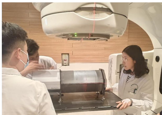
Qingyun County People's Hospital i Kina har valt Delta4 Phantom+ för att stödja oberoende patient-QA på deras Varian TrueBeam.