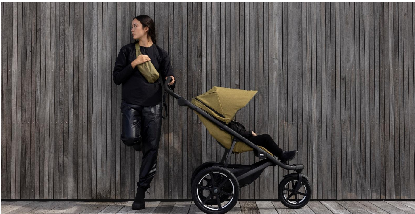
En av världens mest sålda all terrain strollers, Thule Urban Glide lanserades under kvartalet i den tredje generationen.

I region Americas ökade försäljningen i kvartalet med 3,4 procent, valutajusterat. Även i denna region ökade försäljningen av cykelrelaterade produkter. Produktkategorin Juvenile & Pet visade god tillväxt drivet av nya produktlanseringar. Däremot minskade försäljningen inom Packs, Bags & Luggage på grund av betydligt lägre försäljning av legacy produkter som vi fortsätter att successivt fasa ut. De latinamerikanska marknaderna visade tillväxt, medan de nordamerikanska var i nivå med föregående år.