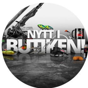
UTVECKLA OCH BREDDA ERBJUDANDET

Söder Sportfiske har en tydlig strategi för att driva lönsam tillväxt, stärka bolagets position på marknaden och säkra framtida konkurrenskraft. Tillväxtstrategin bygger på nedan fyra grundpelare: