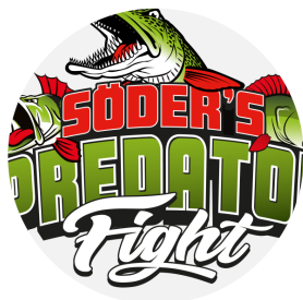
EXPANSION PÅ BEFINTLIG MARKNAD