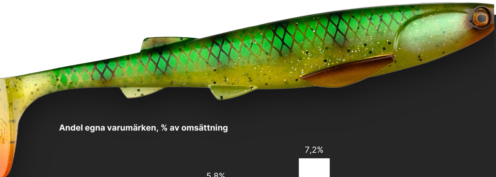
Andel egna varumärken, % av omsättning