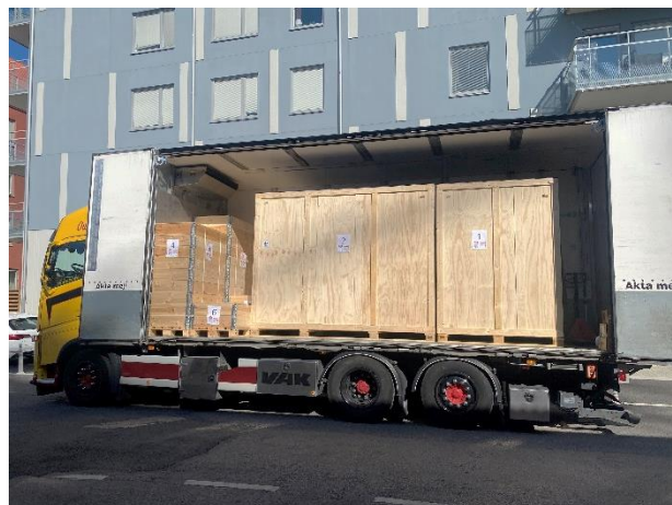
Utleverans från Linköping av beläggningssystemet till Boyuan i Kina i september, bara ett par månader efter orderläggning.

Kunden prioriterades och ett nästan färdigt beläggningssystem avsett för Impact Coatings nya Coating Service Center i Shanghai anpassades för snabb leverans. Det kunde skickas till Kina för installation redan under kvartalet för att därefter snabbt, strax efter kvartalets utgång, sättas i produktion genom Managed Services. Ett nytt byggprojekt av ett beläggningssystem för Impact Coatings egna verksamhet i Shanghai har påbörjats.