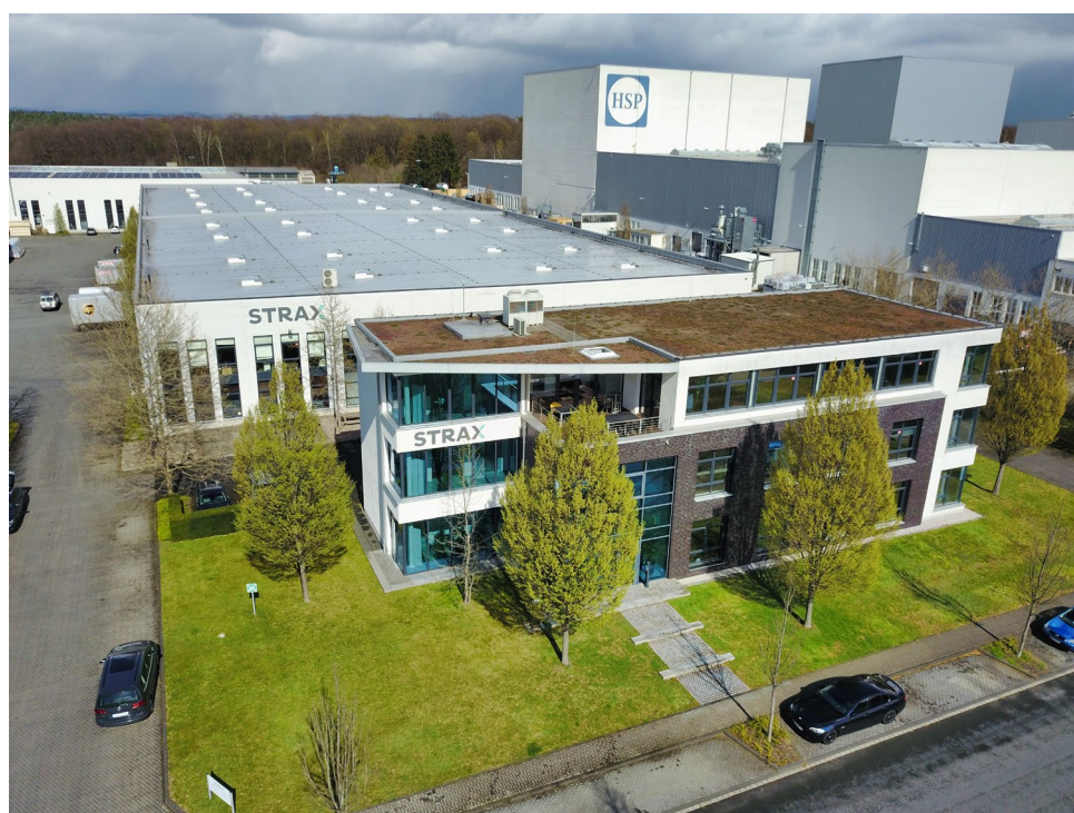
Kontor och logistikcenter i Troisdorf, Tyskland