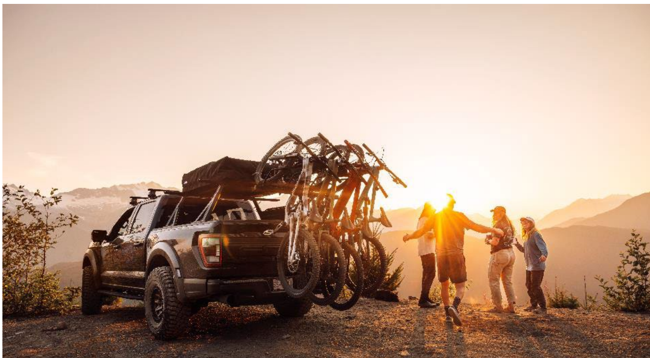
Thule ReVert- vårt första vertikala dragkroksmonterade cykelställ som kan transportera upp till sex cyklar. Oavsett om det är en familjeutflykt eller ett cykeläventyr med vänner låter Thule ReVert dig enkelt ta med allas cyklar.

Inom Packs, Bags & Luggage minskade försäljningen med 4 procent valutajusterat jämfört med tredje kvartalet föregående år. Försäljningen minskade för de så kallade legacy produkterna, som vi fortsätter att aktivt fasa ut. Även Thule-varumärkets sortiment har haft en svagare försäljningsutveckling. Packs, Bags & Luggage stod för 9 procent av den totala försäljningen i kvartalet.