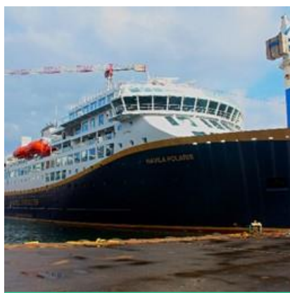
Överst: Climeons ingenjörer vid Tersan Shipyard i Turkiet för driftsättningsarbeten ombord på Havila Polaris.