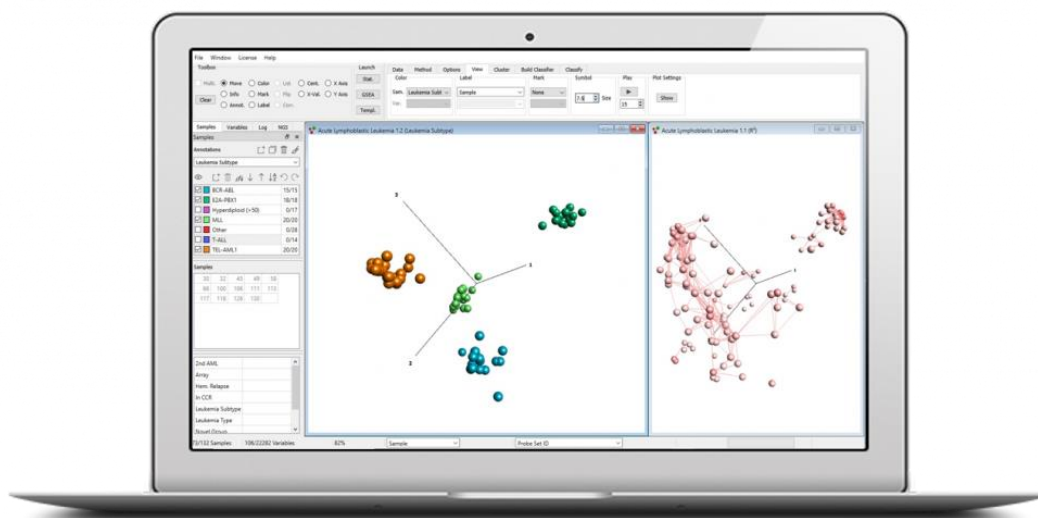
Qlucore Omics Explorer