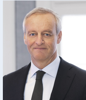
Vd Bure Equity AB

Efter ett svagt tredje kvartal avslutades 2023 med en kraftig uppgång under det fjärde kvartalet. SIX RX steg med 13,9 procent och Bures substansvärde per aktie med 18,5 procent. Sammantaget var 2023 ett bra år för Bure. Substansvärdet per aktie ökade med 31,4 procent att jämföra med SIX RX som steg med 19,2 procent.