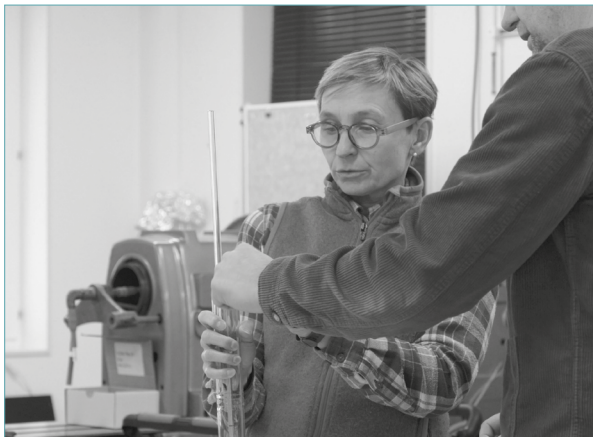
Under 2024 har Luxbright etablerat avancerade kompetenser för hela tillverkningsprocessen av röntgenrör, inklusive glasarbete, för att säkerställa högsta kvalitet och precision.