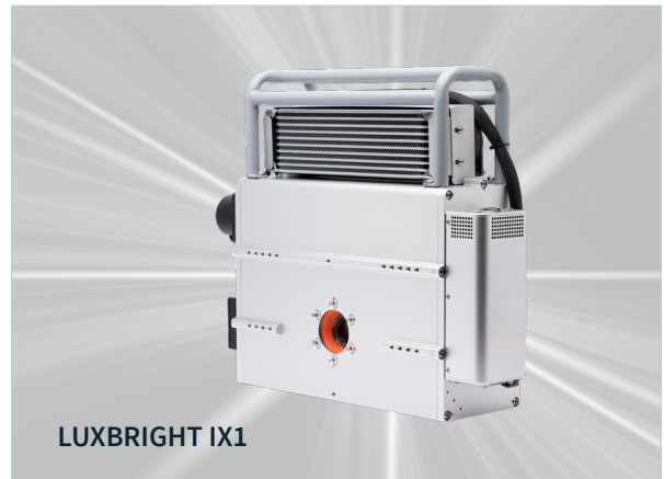
Luxbright IX1 är en komplett, fullt integrerad röntgenkälla med röntgenrör, högspänningsaggregat och kontrollelektronik i en kompakt enhet. Tillämpningar inkluderar batteriutveckling och inspektion, samt additivt tillverkade eller gjutna delar.