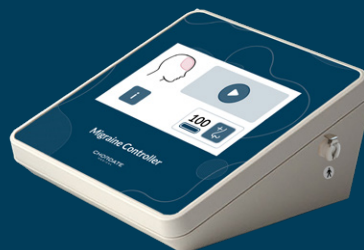
KONTROLLENHET Kontrollerar behandling Säkerställer att giltiga behandlingskoder används