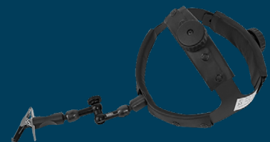
HEADBAND Hållare för bekväm applicering av kateter