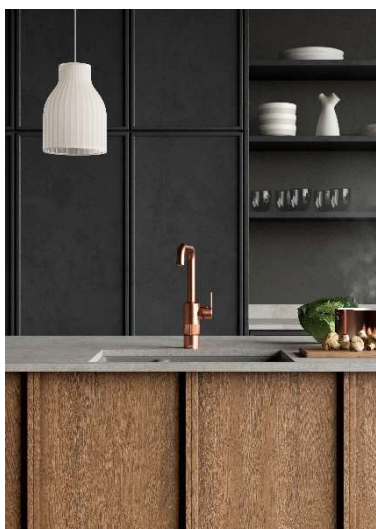
Damixa Instant, köksblandare i borstad mässing.

Beskrivning av närståendetransaktioner framgår av årsredovisningen för räkenskapsåret 2021.