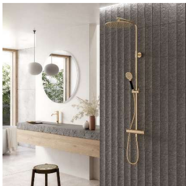
Mora Armatur INXX dusch och tvättställsblandare i mässing.