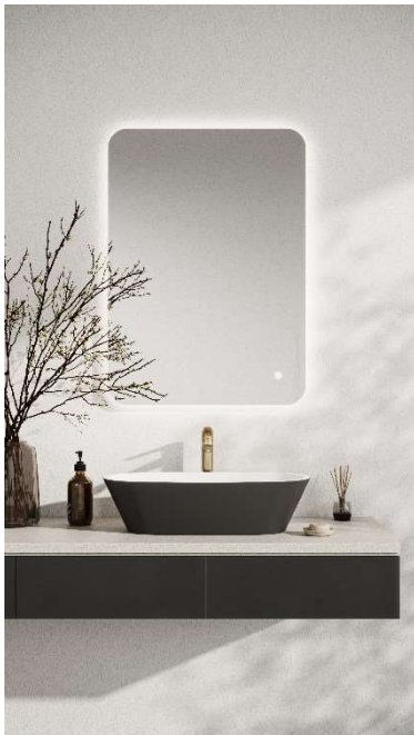
Aqualla spegel Fuse och tvättställsblandare Hanna.

” Vi tar helt nya positioner i marknaden genom förvärvet av företaget Aqua Invent ”