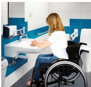
FM Mattsson Medicare.

Medelantalet anställda uppgick till 557 (529) under perioden.