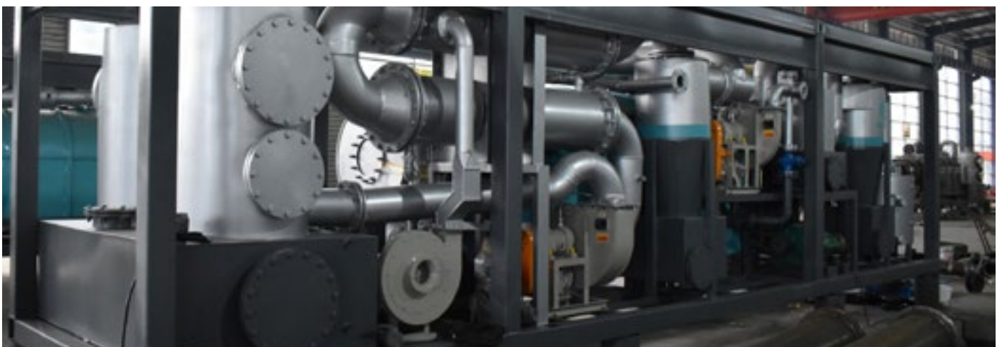
Abb. Pyrolysemaschine nach dem neuesten Stand der Technik

Es ist wahrscheinlich, dass Creturner im Jahr 2024 weitere Werke, möglicherweise auch im Ausland, errichten muss. Um mit dem erwarteten Anstieg der Kundennachfrage Schritt halten zu können, wird Creturner auf jeden Fall seine bestehenden Produktionskapazitäten erheblich erweitern müssen.