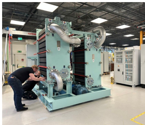
HeatPower 300 enheter på Climeons testsite i Kista som ska levereras till varv i Kina. Inspektion både av kunder samt Climeons egen personal.