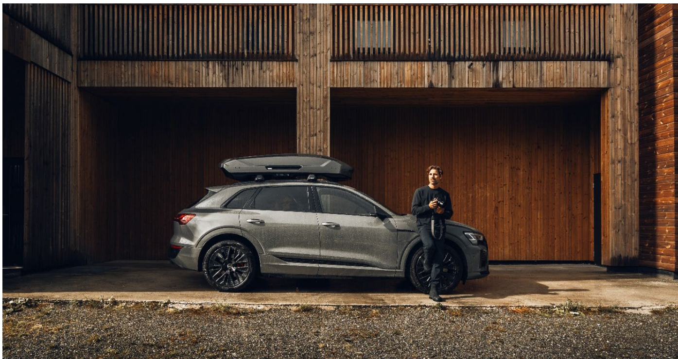
Thule Motion 3, en uppdatering av världens mest sålda takbox, är designad för att passa in i ett föränderligt fordonslandskap.

Inom Packs, Bags & Luggage ökade försäljningen med 5 procent valutajusterat jämfört med andra kvartalet föregående år. Thule-varumärkets sortiment har haft en positiv försäljningsutveckling drivet av produktlanseringar och ett ökat resande. Försäljningen minskade däremot för de så kallade legacy produkterna, som vi fortsätter att aktivt fasa ut. Packs, Bags & Luggage stod för 8 procent av den totala försäljningen i kvartalet.