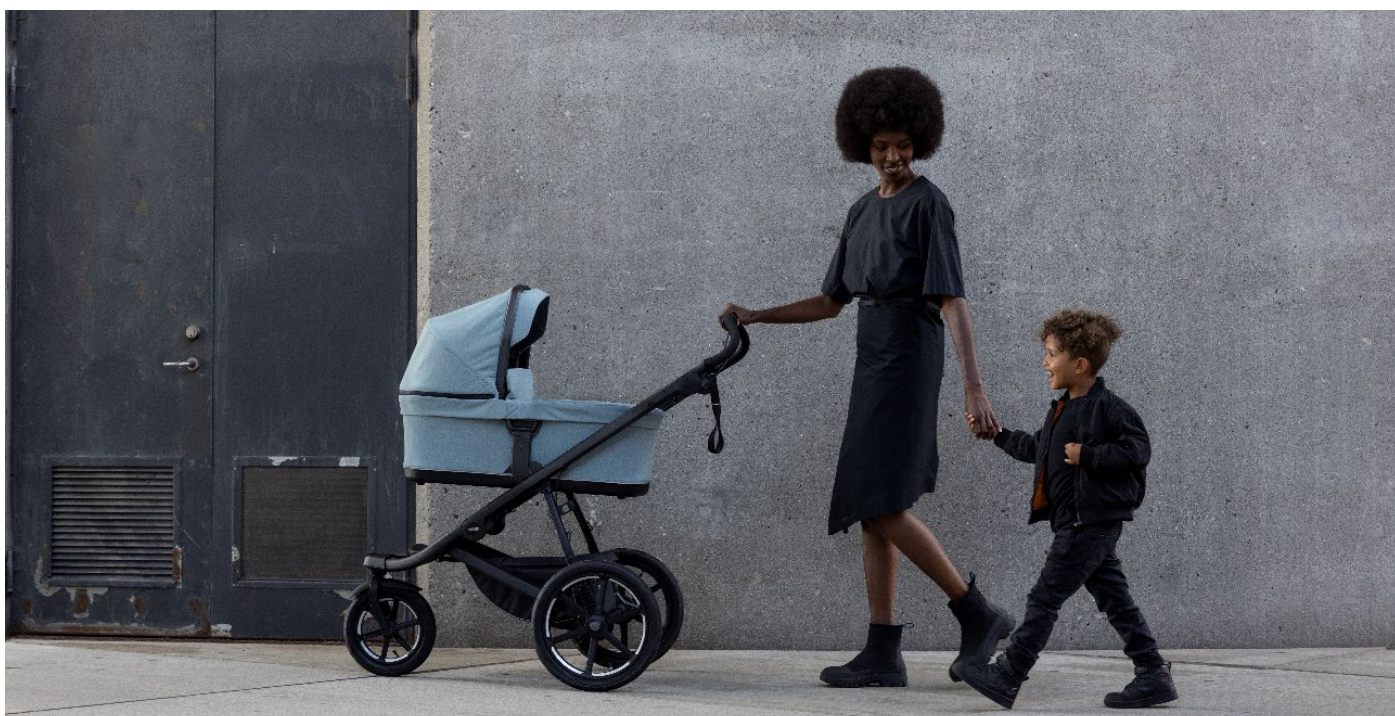
Den uppdaterade och ikoniska barnvagnen för all terräng, Thule Urban Glide 3, vann iF Gold Award 2024.

I region Americas ökade försäljningen i kvartalet med 1,0 procent, valutajusterat. Den nordamerikanska marknaden var fortsatt utmanande med hög kampanjintensitet. Försäljningen av cykelrelaterade produkter, Juvenile & Pet och Thule varumärkets produkter inom Packs, Bags & Luggage ökade. RV Products utgör en liten del av försäljningen i denna region. Tillväxten var svagt positiv i USA, den enskilt största marknaden, och i Brasilien.