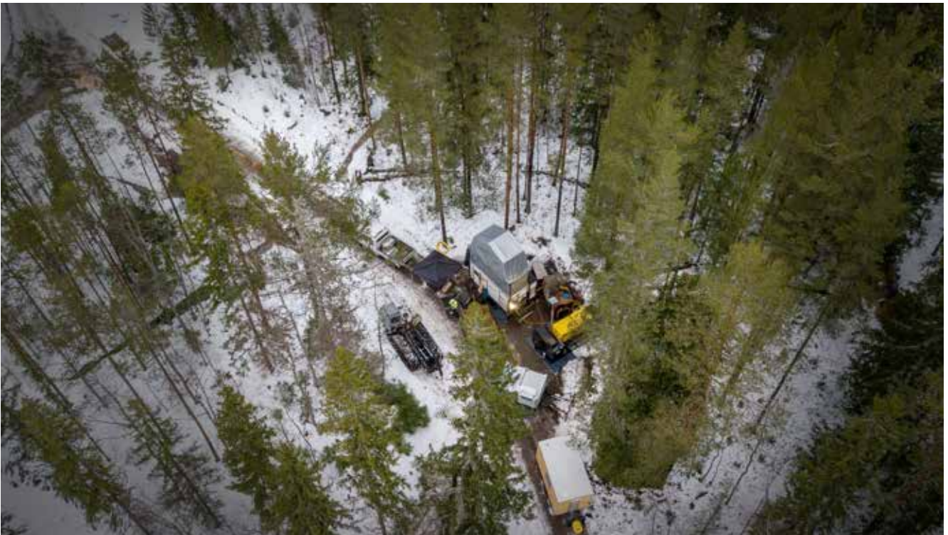
Djupborrningsprogram i Blötberget för att utforska järnoxidresurser och sällsynta jordartsmetaller (REE).

Järnmalmspriset hade en nedåtgående trend under stora delar av 2024, men ser ut att ha stabiliserats under fjärde kvartalet. Bolagets planerade produktion av ultra höganrikat järnmalmskoncentrat innebär lägre energiförbrukning och koldioxidutsläpp, oavsett om stållinverknigen sker via masugn eller direktreduktion. Hög järnhalt minskar dessutom transportvolymen och slaggavfallet. Detta gör vår produkt attraktiv i den pågående omställningen av stålindustrin. Även om marknaden just nu pekar mot ett överskott av höghaltiga järnmalmsprodukter fram till omkring 2030, förväntas en brist uppstå därefter i takt med industrins omställning. Det är den framtida marknaden vi fokuserar på – inte kortsiktiga prisvariationer.