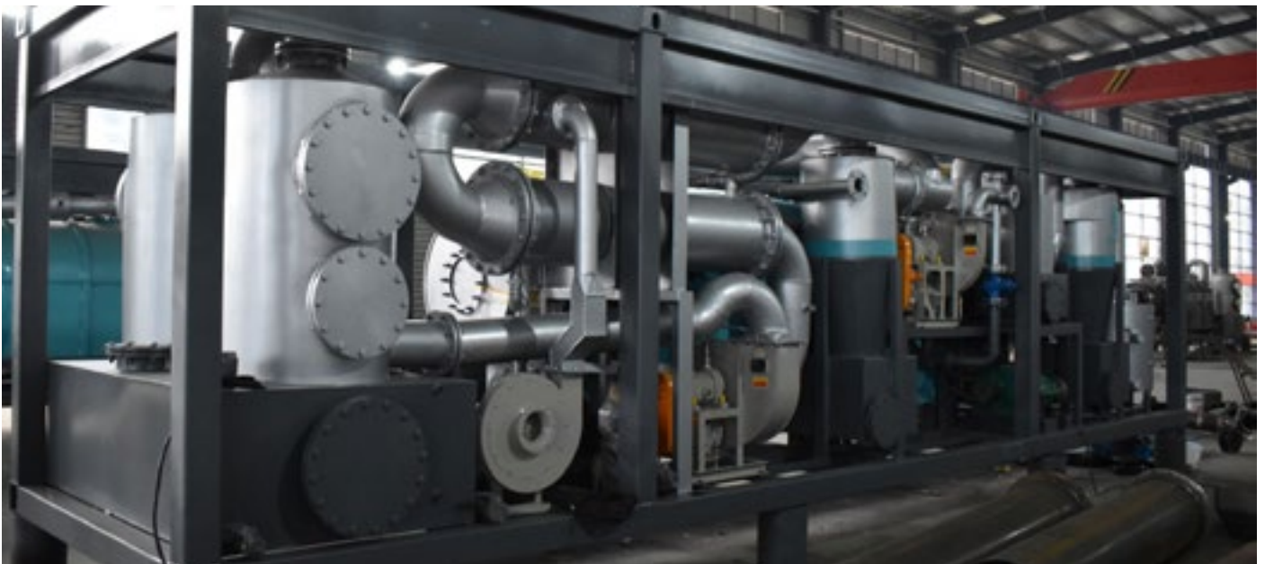
fig. Pyrolysmaskin av senaste teknik

Det är sannolikt att Creturner under 2024 behöver etablera fler anläggningar, eventuellt även utomlands. För att kunna svara på den förväntade ökningen från kunder, måste Creturner definitivt förstärka och utöka den befintliga produktionskapacitet betydligt.