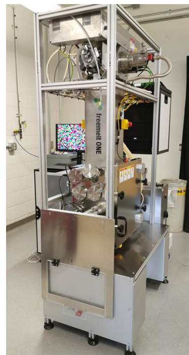
Maskin F1020 levererad till University of Michigan

Under årets första kvartal fortsatte vi vår kommersiella resa. Vi befinner oss på en marknad för avancerad kommersiell 3D-printing och där kundernas krav utvecklas snabbt. Inte minst eftersom 3D-skrivare i allt större utsträck-