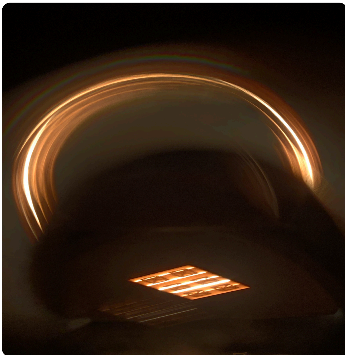
Smältning av volfram i ett Freemelt ONE®-system

Denna information är sådan information som Freemelt Holding AB (publ) är skyldig att offentliggöra enligt EU:s marknadsmissbruksförordning. Informationen lämnades för offentliggörande den 10 maj 2023.