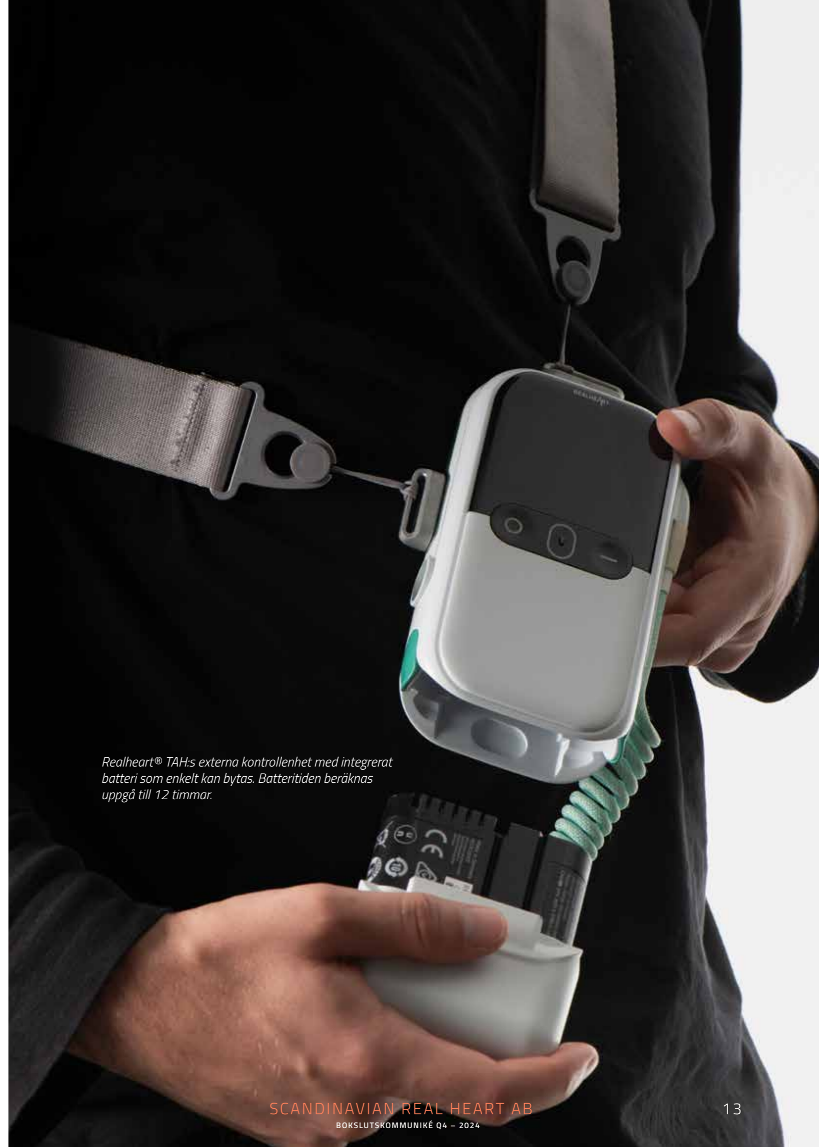
Realheart® TAH:s externa kontrollenhet med integrerat batteri som enkelt kan bytas. Batteritiden beräknas uppgå till 12 timmar.

Aktien noterades på Nasdaq First North Growth Market i december 2021. Nasdaq First North GM är en registrerad SME-marknadsplats för tillväxtbolag som gör det möjligt för nordiska och internationella entreprenörer att få tillgång till tillväxtkapital för att utveckla och expandera sina verksamheter. Per den 31 december 2024 uppgick antalet aktier i Scandinavian Real Heart AB till 2 068 152 stycken.