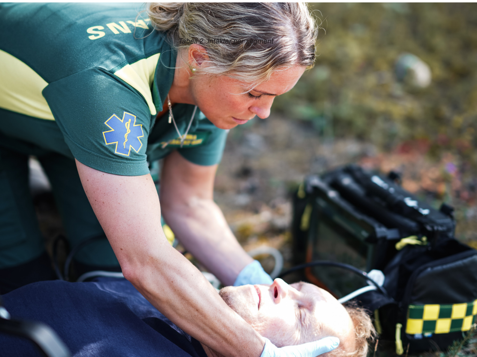
Tabell 2. Infäkter per segment