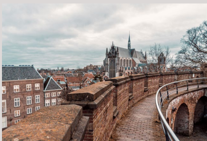
R&D Offices Emmy Noetherweg 2K 2333 BK Leiden Holland