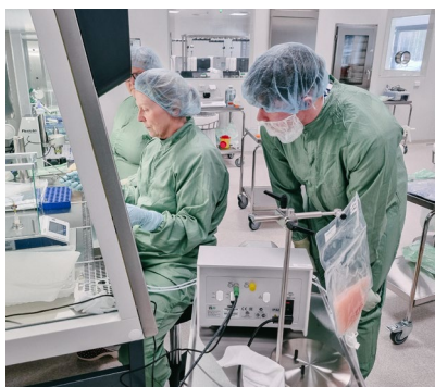
Tillverkning av de första storskaliga GMP-batcherna av vididencel hos NorthX.

medlet för underhållsbehandlingen av AML. Utöver de positiva data som redan rapporterats från den pågående ADVANCE II-studien, kommer data från CADENCE-studien bidra till den globala registreringsdokumentationen för vididencel vid AML.