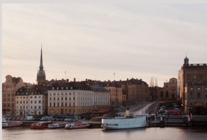
Head Office Västra Trädgårdsgatan 15 111 53 Stockholm Sverige