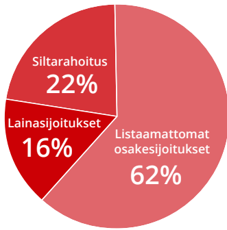
ALUEELLISET SIOITUKSET käypä arvo 17,5 Meur 3)