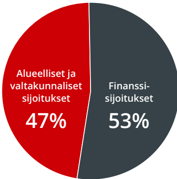
SIJOITUKSET 12/2023 tasearvo 105,0 Meur