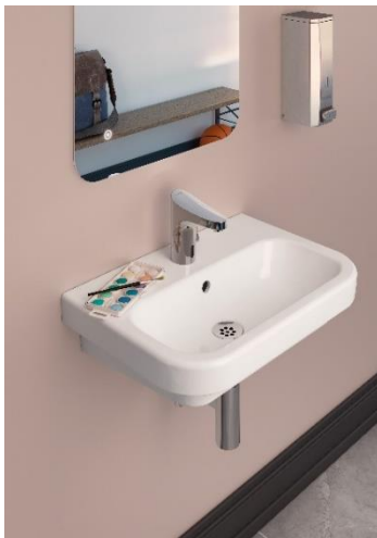
FM Mattsson Tronic beröringsfri blandare i skolkorridor.

Realiserade terminssäkringar har utfallit med 0,8 Mkr (-0,6).