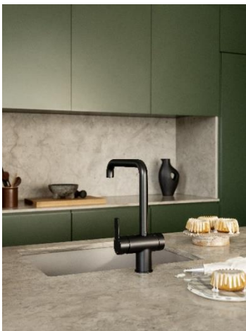
Mora LYNX köksblandare.

Avslutningsvis är det viktigt att lyfta fram att vi tar marknadsandelar även under detta kvartal i vissa prioriterade kundsegment. Vi har i alla våra varumärken produkter som uppskattas av våra kunder och en nära lokal kundservice. Under det här kvartalet har vi fortsatt det arbetet genom att lansera vår helt nya produktserie Mora Lynx som kombinerar modern design med flera hållbarhetsfördelar för kunderna, samt även introducerat våra första köksblandare med energiklass A som ett led i vårt hållbarhetsarbete. Under kvartalet invigde vi även vårt nya Damixa Experience Centre i Nederländerna för att ta nya kliv som en intressant partner till våra Damixa-kunder i Västeuropa. Sammantaget viktiga framsteg för att fortsätta utveckla vårt samarbete tillsammans med våra kunder och att vara deras första val.