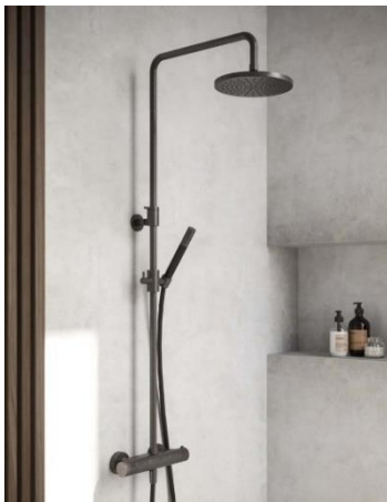
Hotbath Cobber duschset.

Moderbolagets investeringar i materiella anläggningstillgångar uppgick under perioden januari-september till 23,9 Mkr (19,8) och avsåg huvudsakligen produktionsanläggningen i Mora.