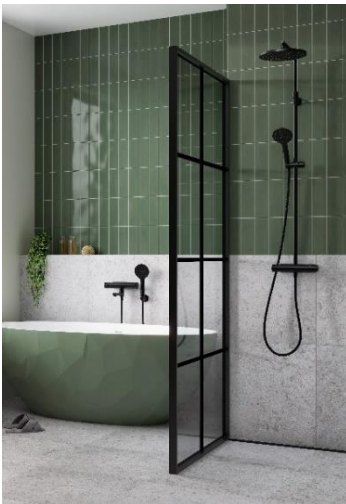
Mora LYNX dusch- och badkarsblandare.

FM Mattsson Group har som regel en högre fakturering under första halvåret. Den lägre andelen fakturering under andra halvan av räkenskapsåret förklaras av månaderna juli, augusti och december vilka har lägre aktivitet hos kunderna.