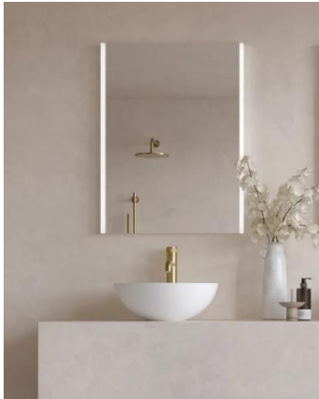
Aqualla Stena spegel och Adamsez Orb handfat.

Värdering av derivat kopplat till inköp av valuta har gjorts till verkligt värde, nivå 2, baserat på noterade valutakurser på bokslutsdagen och redovisas som övriga skulder med -0,8 Mkr (-0,7).