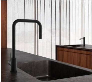
Mora Inxx Pullout köksblandare.