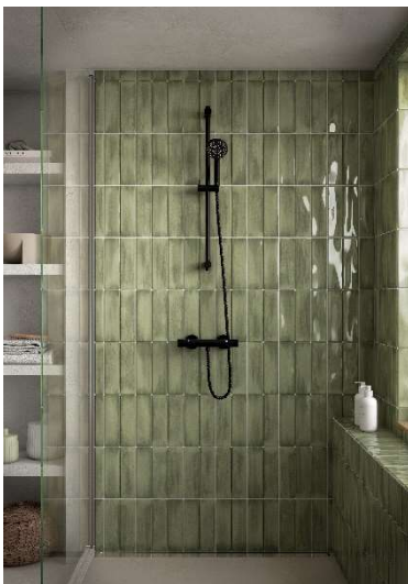
Damixa Core Combo duschet.

Medelantalet anställda uppgick till 556 (574) under perioden.