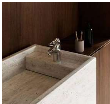
FM Mattsson 9000XE tvättställsblandare.