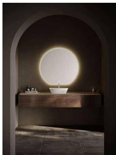
Aquilla Horizon spegel.