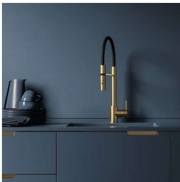
Hotbath Fellow köksblandare.

Försäljningen i det första kvartalet uppgick till totalt 493 miljoner kronor, 7,5 procent lägre än första kvartalet 2023, som var ett starkt kvartal med vår näst högsta omsättning någonsin. EBITA-marginalen påverkades av den lägre försäljningen och uppgick till 10,8 procent jämfört med 14,7 procent motsvarande kvartal 2023. Kassaflödet har varit fortsatt starkt.