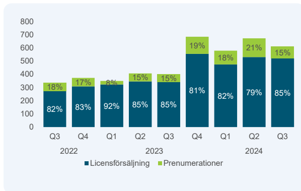
Orderingång per kvartal, mkr