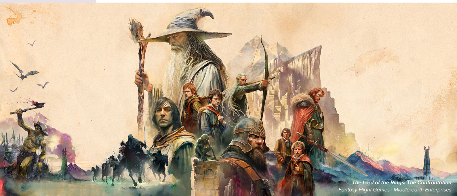
The Lord of the Rings: The Confrontation Fantasy Flight Games | Middle-earth Enterprises

Kassaflöde från finansieringsverksamheten uppgick till -930 MSEK (-9 335) under kvartalet, varav upptagna lån uppgick till 182 MSEK (388) och minskat nyttjande av kreditfaciliteter uppgick till -1 061 MSEK (-5 083). Betalningar mottagna från eller givna till verksamhet under avveckling uppgick till 0 MSEK (-4 566).