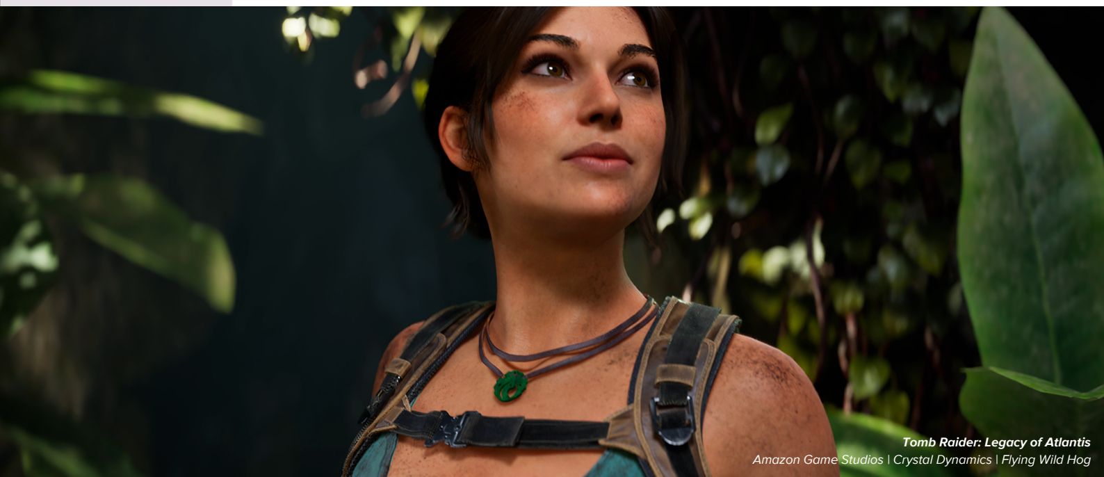
Tomb Raider: Legacy of Atlantis Amazon Game Studios | Crystal Dynamics | Flying Wild Hog