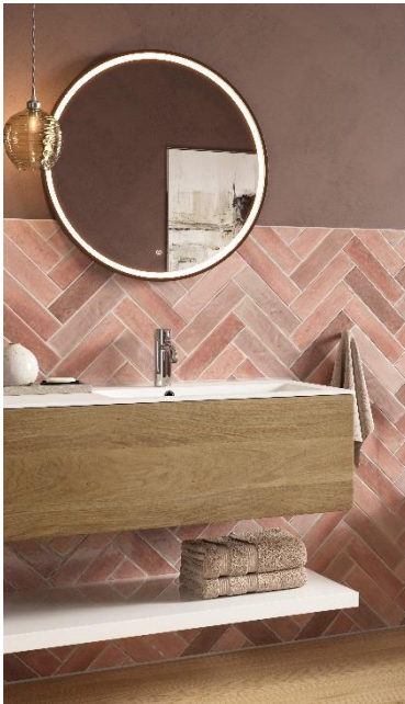
Damixa Silhouet tvättställsblandare i krom.