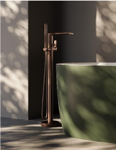
Aqualla Hanna fristående dusch- och badkarsblandare