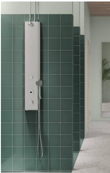
FM Mattsson Tronic duschpanel.

Tilläggsköpeskillingen, avseende förvärvet av Aqualla Brassware Ltd, har slutbetalats med 17,5 Mkr under våren 2024.