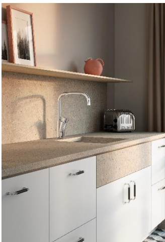
Mora MMIX II köksblandare i krom.

Alla våra varumärken har produkter som ligger bra positionerade utifrån kundernas krav och behov i våra olika segment och regioner. Viktiga ledord i vår strategi har varit och är hållbara produkter med attraktiv design och en bra lokal service. Vi ser tydliga kvitton på att den strategin hjälper oss i ett utmanande marknadsläge och att vi är väl positionerade för framtiden. Under kvartalet har vi därför också fortsatt stärka upp våra varumärken, bland annat genom att lansera nästa generation av produktserien Mora MMIX för den nordiska marknaden och med mycket fokus på blyfria lösningar och resurseffektiva vattenflöden i blandarna. Under våren har vi även lanserat den helt nya produktserien Hotbath ACE som, med moderna färger och formspråk, rullas ut för fullt i badrumsbutiker i Västeuropa. I ett utmanande marknadsläge känns det så klart extra roligt att vi kan investera i framtiden för att vara en fortsatt stark partner till våra olika kunder.