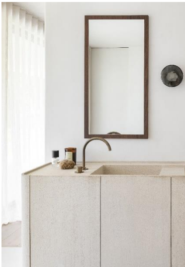
Hotbath Cobber tvättställsblandare.