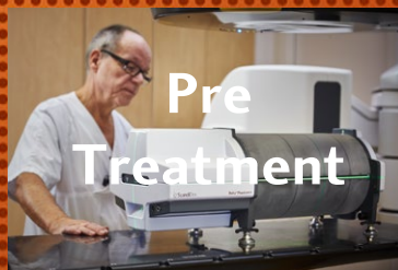
DELTA4 PHANTOM+ DELTA4 PHANTOM+ MR DELTA4 HEXAMOTION