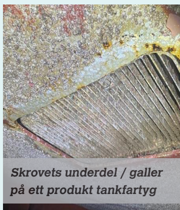
Skrovets underdel / galler på ett produkt tankfartyg