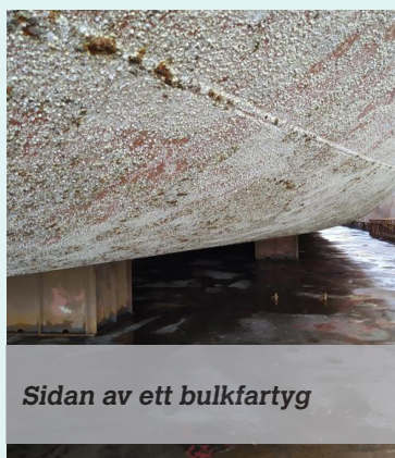
Sidan av ett bulkfartyg

bolagets teknologi. Sju av dem är kommersiellt aktiva, övriga befinner sig i utvecklingsstadiet. Tack vare en fortsatt mycket stabil finansiell ställning har tydliga investeringar gjorts inom kärnverksamheten. Inom det regulatoriska området ökas den geografiska täckningen steg för steg samtidigt som uppgraderingar och förnyelser av existerande godkännande krävs med jämna mellanrum. Bolaget investerar också inom forskning och utveckling i linje med strategin att erbjuda ett högre kunskapsvärde kring Selektopes formuleringsegenskaper i antifoulingfärg. Det kontinuerliga förbättringsarbetet har också lett till en utökad leveranskapacitet och effektivitet i produktionskedjan.