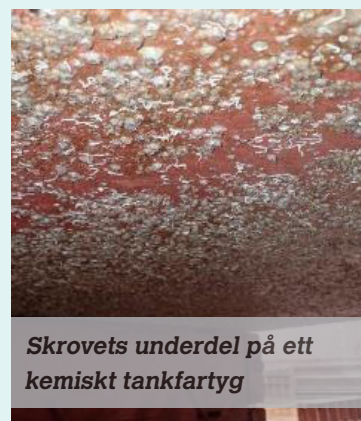
Skrovets underdel på ett kemiskt tankfartyg

Bilder: Observationer av havstulpanpåväxt under skrovinspektioner av Safinah Group