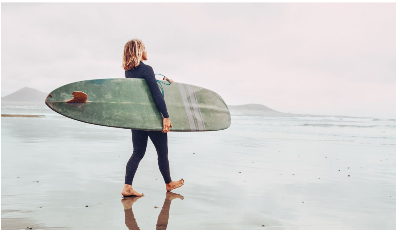
Cancerbehandling utan att skada hälsa eller livskvalitet.

Mendus utvecklar nya cancerterapi baserade på att utnyttja immunsystemets kraft för att kontrollera kvarvarande sjukdom och förlänga cancerpatienternas överlevnad utan att försämra hälsan eller livskvaliteten.