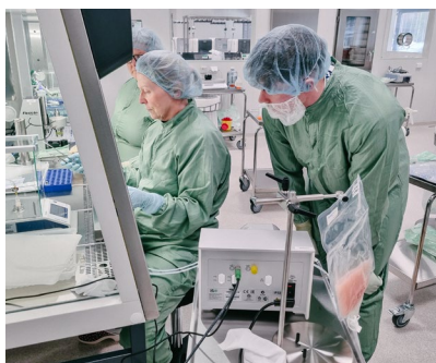
Tillverkning av de första storskaliga GMP-batcherna av vididencel hos NorthX.

De positiva monoterapidata från ADVANCE II stöder expansionen av den kliniska utvecklingen av vididencel i AML. Mendus har ingått ett samarbete med Australasian Leukemia & Lymphoma Group (ALLG) för att studera vididencel i kombination med oralt azacitidin (AZA), den enda godkända underhållsbehandlingen för AML-patienter som ej kan erhålla transplantation. AMLM22-CADENCE studien är en multicenter, randomiserad kontrollerad studie som jämför