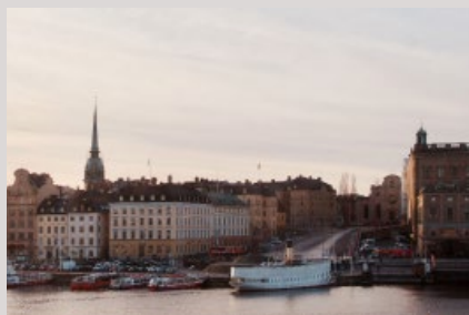
Head Office Västra Trädgårdsgatan 15 111 53 Stockholm Sverige