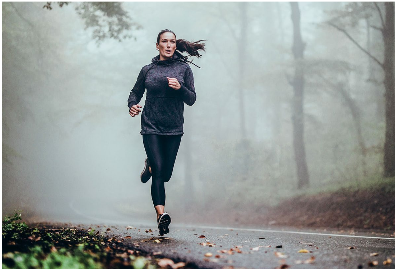
Cancerbehandling utan att skada hälsa eller livskvalitet.

Mendus utvecklar nya cancerterapierna genom att utnyttja immunsystemets kraft. Våra produkter syftar till att uppnå varaktiga kliniska svar utan att skada hälsa eller livskvalitet.