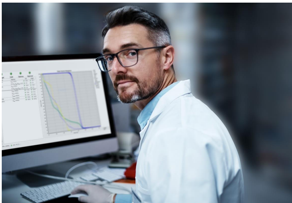
Mjukvaran Delta4 Insight kompletterar ScandiDos produktportfölj för patient QA som nu täcker patient QA från ordination till sista behandlingstillfället.

ScandiDos utvecklar den nya generationens mätsystem och lägger ut produktionen på specialister inom respektive tillverkningsområde, nationellt och internationellt. Marknadsföring och försäljning styrs från huvudkontoret i Uppsala samt via dotterbolag i USA, Frankrike och Kina. I Malaysia representeras bolaget genom säljfilial och i resterande länder bidrar ett 40-tal distributörer till bolagets framgångar. Därtill har bolaget en serviceorganisation med världsomspännande räckvidd som aktivt stödjer produktanvändarna.