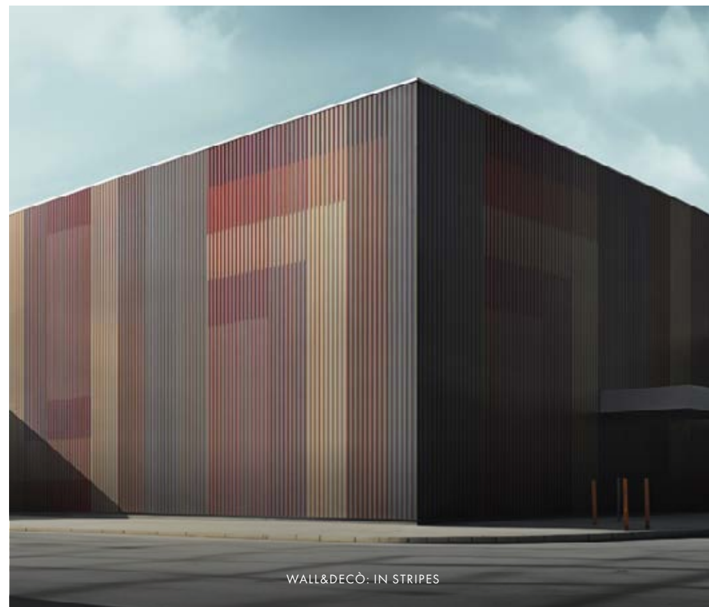
WALL&amp;DECÖ: IN STRIPES

Koncernens balansomslutning uppgick vid kvartalets slut till 826 MSEK (858). Soliditeten uppgick till 60,4 procent (49,6) och likvida medel vid kvartalets slut uppgick till 47 MSEK (49). Koncernens nettoskuld uppgick vid kvartalets slut till 132 MSEK (242). Nettoskuld/EBITDA R12 uppgick vid kvartalets slut till 1,0 (2,2).