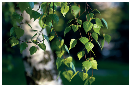
Miljökonsekvensbeskrivning för finskt gruvprojekt godkänd.