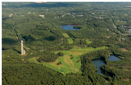
Förvärv genom en riktad emission gör Eurobattery Minerals majoritetsägare i det finska Hautalampi projektet.