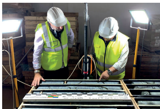
Eurobattery Minerals fokuserar på Finland och Spanien – kommer inte att förnya licenserna i Sverige.