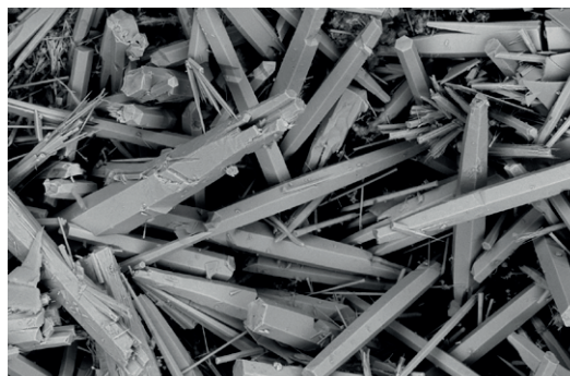
Ny banbrytande metod möjliggör nästan 100 % utvinning av sällsynta jordartsmetaller i Fetsjön.