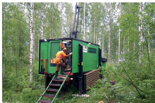
Eurobattery Minerals Hautalampi gruvrättighet listad i Finlands officiella gruvregister