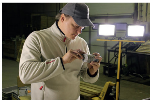
Eurobattery Minerals Hautalampi projekt uppnår högsta FN-klassificering för ett livskraftigt gruvprojekt.