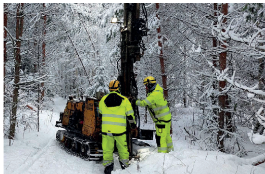
Förstudie pekar på goda ekonomiska utsikter för Hautalampigruvan.