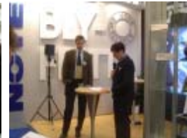
NOTE i täten inom RoHS - nyhetskonferens Elmia, Jönköping