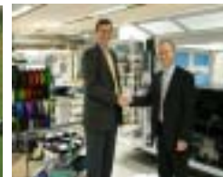
Micronic, en av de nya kunderna under 2004