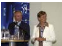
Invigning av Torsbys nya fabrik med Sven-Göran Eriksson och Gerd Levin- Nygren "ÅretsChef"