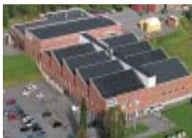
Förvärvet i Norrland, NOTE Skellefteå