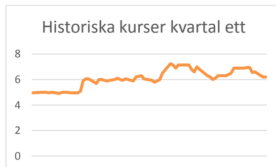
Historiska kurser under januari - mars 2015.

InXL innovation AB är listat på First North Premier under namnet INXL. Totalt hade InXL innovation AB 2050 aktieägare vid utgången av kvartalet och antalet aktier uppgick till 34 114 900 st. Den 1 januari 2015 uppgick betalkursen för InXL's aktie till 4,96 SEK. Sista betalkurs den 31 mars 2015 uppgick till 6,20 SEK vilket motsvarar ett börsvärde på ca 211 MKR.