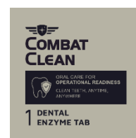
The new 1pcs sample

Clean Teeth Enzyme Tab fokuserar på militär och Försvarsmakt där tandsjukdomar är en av de vanligaste icke-stridsrelaterade skadorna under militära operationer, med 150–200 akuta tandvårdsfall per 1 000 personer årligen i aktivt tjänstgörande styrkor. Tandproblem leder ofta till att personal behöver evakueras från sina uppdrag, vilket resulterar i tidsförlust och påfrestningar på resurserna samt påverkar den operativa beredskapen negativt. CombatClean kan här spela en viktig roll genom att erbjuda effektiv och smidig tandvård för personalen ute i fält.