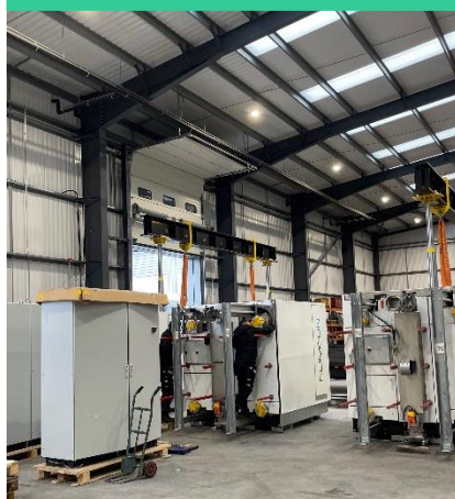
Överst: Flygfoto över den pågående byggnationen vid Landmark Power Holdings' kraftverk Rhodesia.