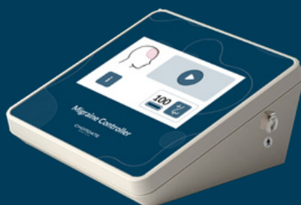
KONTROLLENHET Kontrollerar behandling Säkerställer att giltiga behandlingskoder används