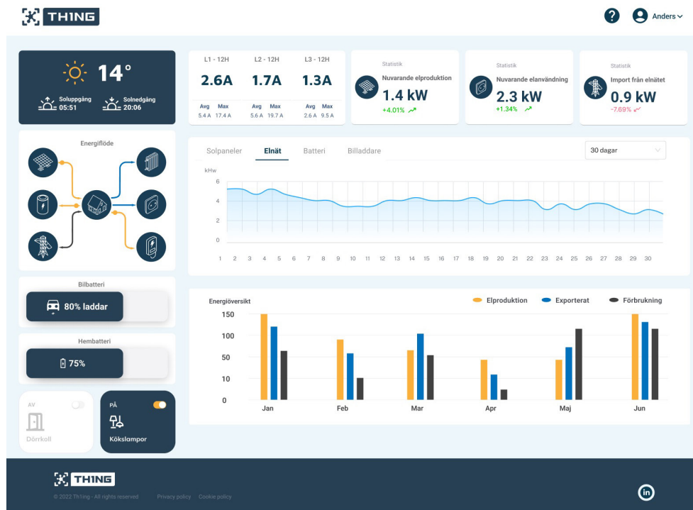
Exempel på hur en visualisering kommer att kunna se ut för kund.

som grund, vilken möjliggör för fastighetsägaren att samla all data och information centralt. Med denna lösning, som vi benämner "IoT Open Ready", kan fastighetsägaren koppla ihop samtliga enheter och sensorer i fastigheten, för att få tillgång till all data centralt i sitt administrativa system, alternativt i TH1NGs webb- eller appgränssnitt.