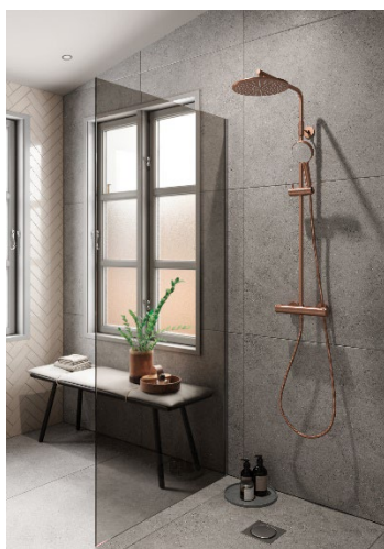
Damixa Silhouet takduschpaket.

Beskrivning av närståendetransaktioner framgår av årsredovisningen för räkenskapsåret 2023.