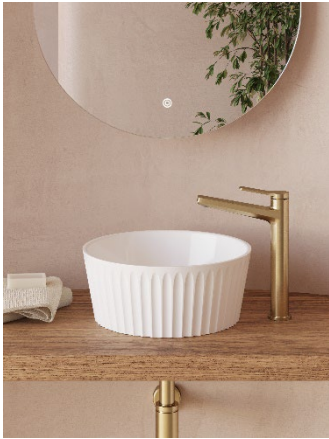
Adamsez Sonata handfat.

Värdering av derivat kopplat till inköp av valuta har gjorts till verkligt värde, nivå 2, baserat på noterade valutakurser på bokslutsdagen och redovisas som övriga tillgångar med 0,8 Mkr (0,3).