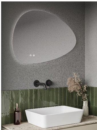
Aqualla Pebble spegel.

Moderbolagets investeringar i materiella anläggningstillgångar uppgick under perioden januari-december till 27,5 Mkr (25,9) och avsåg huvudsakligen produktionsanläggningen i Mora.