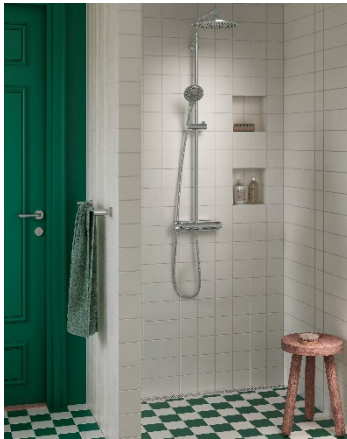
FM Mattsson 9000XE takduschpaket.

FM Mattsson Group utsätts genom sin verksamhet för operativa, strategiska och finansiella risker. Till de operativa och strategiska riskerna kan bland annat nämnas verksamhets- och ansvarsrisker relaterade till patent, miljö och garantier vad gäller produktansvar. Det förs en löpande dialog med olika intressenter vad gäller miljö och eventuella saneringsbehov. Baserat på dialogen med dessa intressenter och bedömd sannolikhet har avsättningar gjorts för att möta eventuella framtida krav.