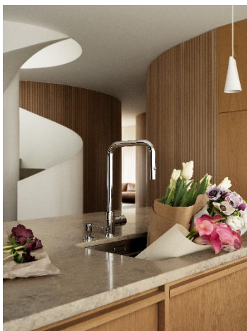
Mora INXX II pullout köksblandare.

Realiserade terminssäkringar har utfallit med 1,8 Mkr (-0,6).