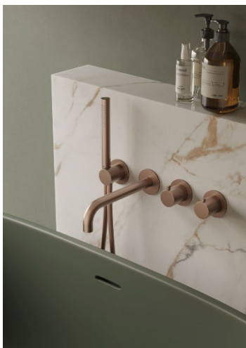
Hotbath Ace inbyggd badkarsblandare