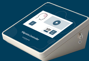
KONTROLLENHET Kontrollerar behandling Säkerställer att giltiga behandlingskoder används