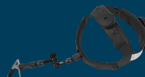
HEADBAND Hållare för bekväm applicering av kateter