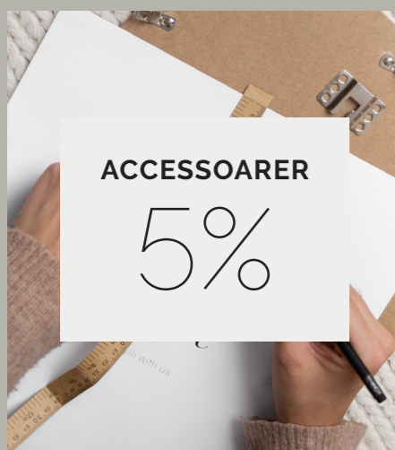
Övriga accessoarer inkluderar tavellister, klämmor, posterhängare samt andra produkter med prints.