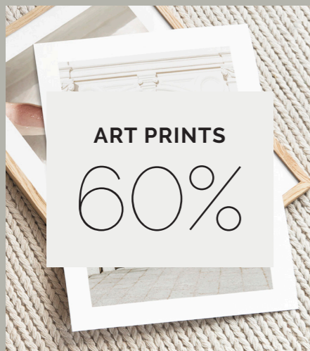
Marknadsledande sortiment med ca 9 000 prisvärda och trendiga motiv där en stor del är unika och skapade av Desenio.