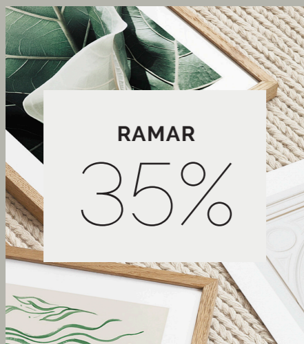
Ramar erbjuds i flera trä- och metallutföranden i storlekar för att passa till motiven.