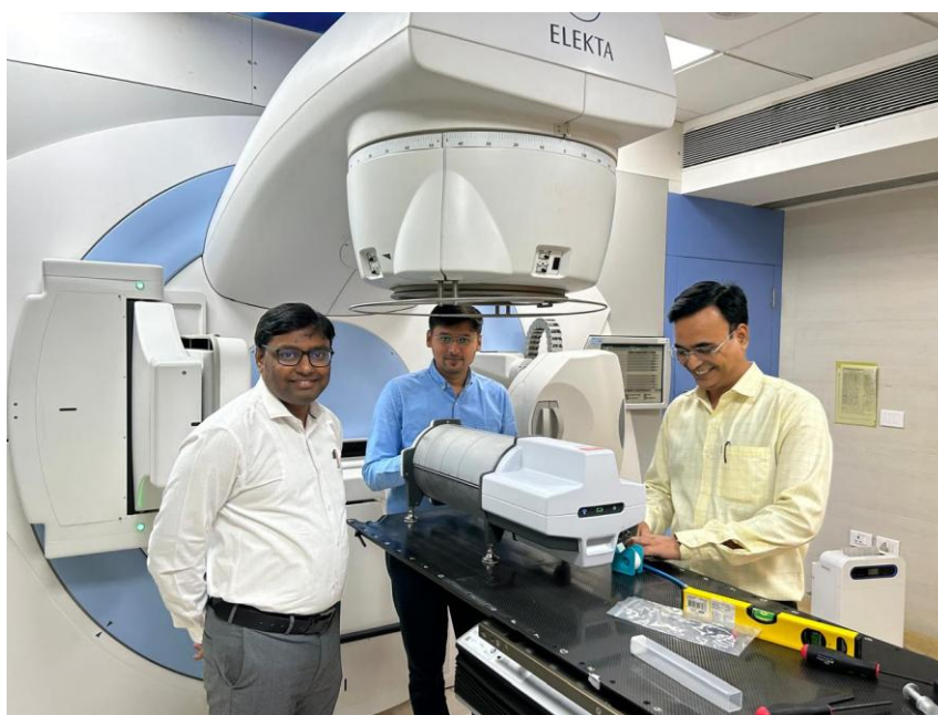
Sahyadri Hospitalet i Pune, Indien har valt Delta4 Phantom+ för kvalitetssäkring av sina strålterapisystem från Accuray och Elekta.

Marknadsföring och försäljning styrs från huvudkontoret i Uppsala samt via dotterbolag i USA, Frankrike och Kina. I resterande länder bidrar ett 40-tal distributörer till bolagets framgångar.