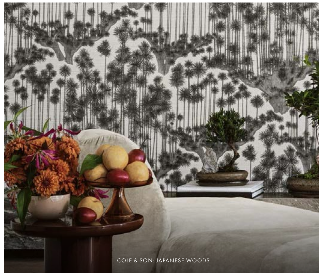
COLE & SON: JAPANESE WOODS

Koncernens balansomslutning uppgick vid kvartalets slut till 830 MSEK (802). Soliditeten uppgick till 65 procent (52) och likvida medel vid kvartalets slut uppgick till 41 MSEK (38). Koncernens nettoskuld uppgick vid kvartalets slut till 99 MSEK (204). Nettoskuld/EBITDA R12 uppgick vid kvartalets slut till 0,7 (1,7).