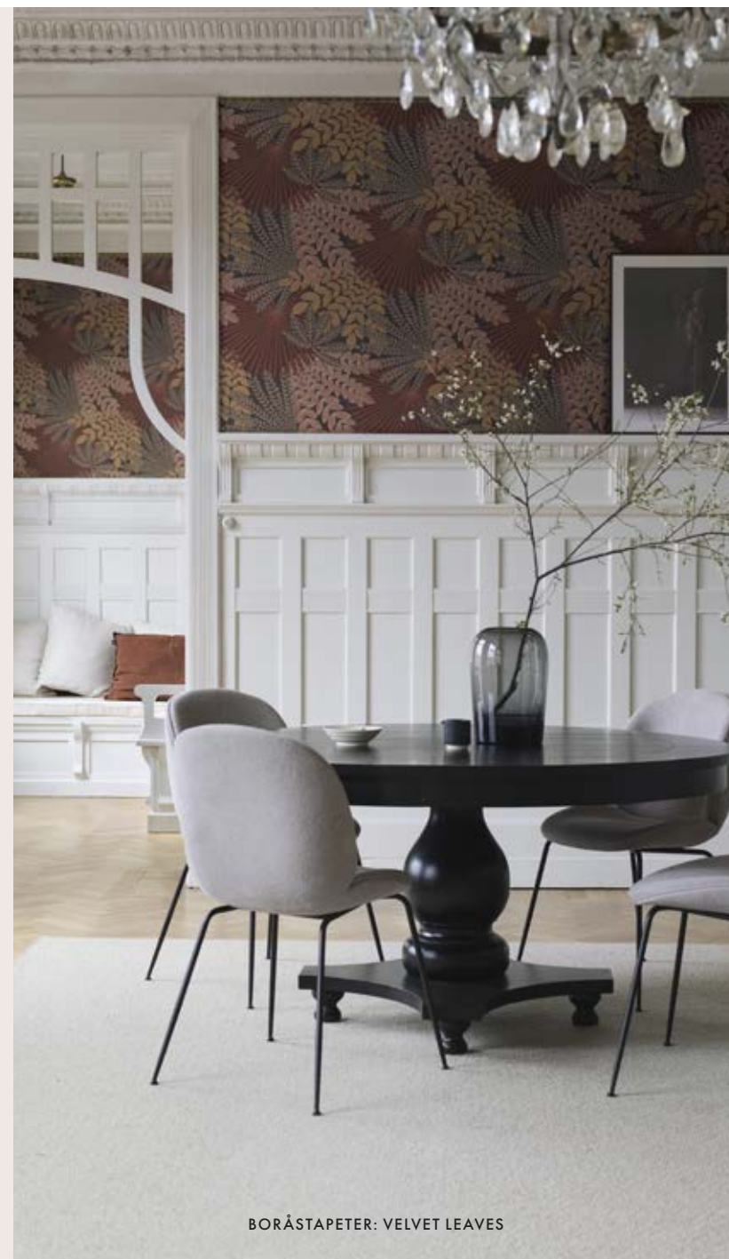
BORÅSTAPETER: VELVET LEAVES