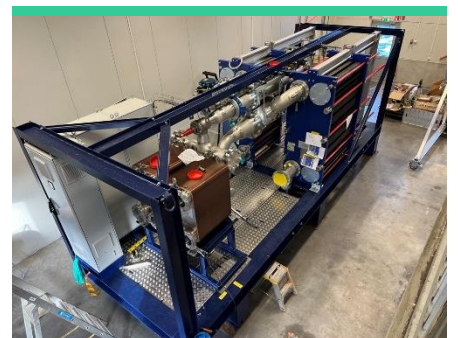
Nedan: Konstruktionsarbete på den nya testmodulen HeatPower 300.