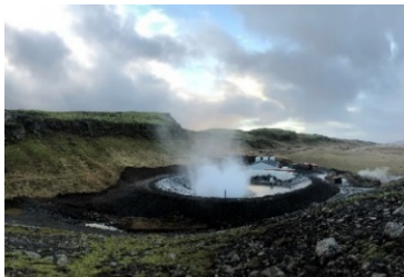
Ytterligare fyra moduler har driftsatts i kraftverket Flúðir på Island