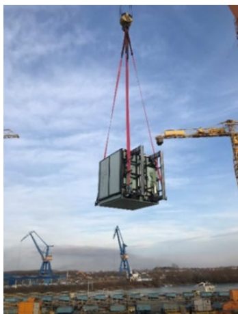
Transport av Climeons moduler på väg mot installation

I början av kvartalet driftsattes ytterligare fyra moduler i kraftverket Flúðir på Island, som därmed fick dubblad kapacitet. Utökningen är ett exempel på hur modularitet och standardisering möjliggör en stegvis utbyggnad. Sett över rullande tolv månader, har kraftverket en tillgänglighet på 98,3 procent. Climeons isländska kund Varmaorka har lagt en ny plan med en utbyggnad på endast 15 MW kraftproduktion fram till 2025, alltså en betydligt lägre takt än tidigare planerat. Som en konsekvens av detta har Climeon beslutat minska den isländska delen av orderstocken. Island är en viktig marknad och det land i världen som har störst erfarenhet av geotermisk kraftproduktion.