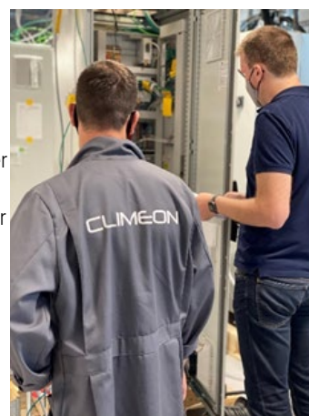
Besiktning i testsiten, DNV godkänner återstående moduler till Havila Voyages