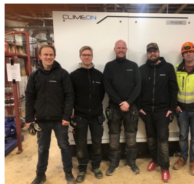
Under kvartalet driftsattes Climeon och Varmaorkas andra kraftverk på Island, Reykholt.