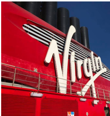
Climeon genomförde framgångsrikt provkörning till havs tillsammans med Virgin Voyages.