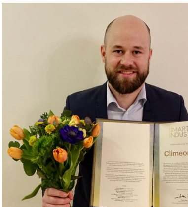
Climeon tog emot kungliga ingenjörsvetenskapsakademiens pris för smart industri. Climeon prisades för sin mjukvaruplattform Climeon Live.