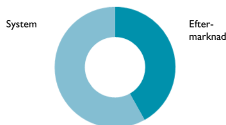
Försäljning per tillämpning, rullande 12 månader

POSTAL ADDRESS Micronic Mydata AB PO Box 3141 SE-183 03 Täby, Sweden